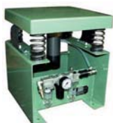
VTP 3/3 met NTS 350 NF pneumatisch