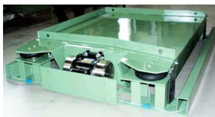
Triltafel met 2 NEG 501510 voor een weegstysteem

Stijma Triltechniek BV Poort van midden Gelderland Rood 21 Postbus 27 6666 ZG HETEREN Holland Tel. : +31-26-4790442 Fax.: +31-26-4790441