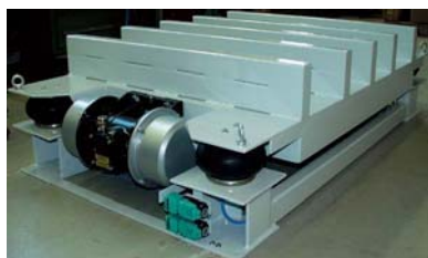
VTF/R 10/12 met 2 NEG 251370 E voor ATEX-omgeving