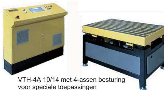
VTH-4A 10/14 met 4-assen besturing voor speciale toepassingen

De keuze van de vibrator kan meestal alleen door trilproeven worden bepaald. Deze proeven doen wij gratis in onze werkplaats te Heteren.