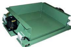
VTF 8/8 met 2 NTS 50/08 zeer lage uitvoering