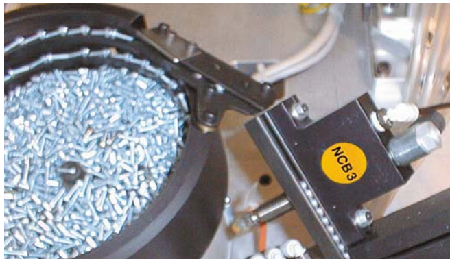
Triage et alignement

*Distances de traçage pour fixation horizontale. Diamètre de perçage ØE