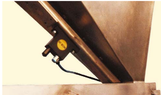
Vidange sans pontage