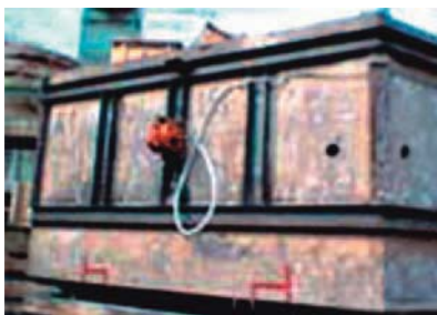
Compactage de sable de moulage