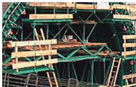
Coffrage de tunnel