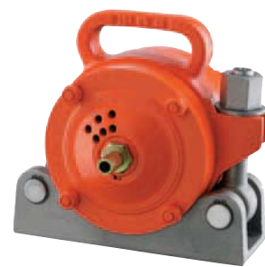
NVT 87 avec fixation NVH 4