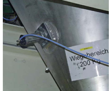
Décolmatage de réservoirs de pesage