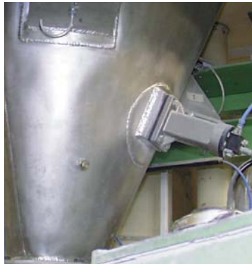
Décolmatage de parois de silos